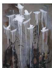
Sisse de Vaublanc

Dans des élans créateurs, tels des soldats du bonheur, les artistes nous apportent l'espoir dans toute sa lueur.